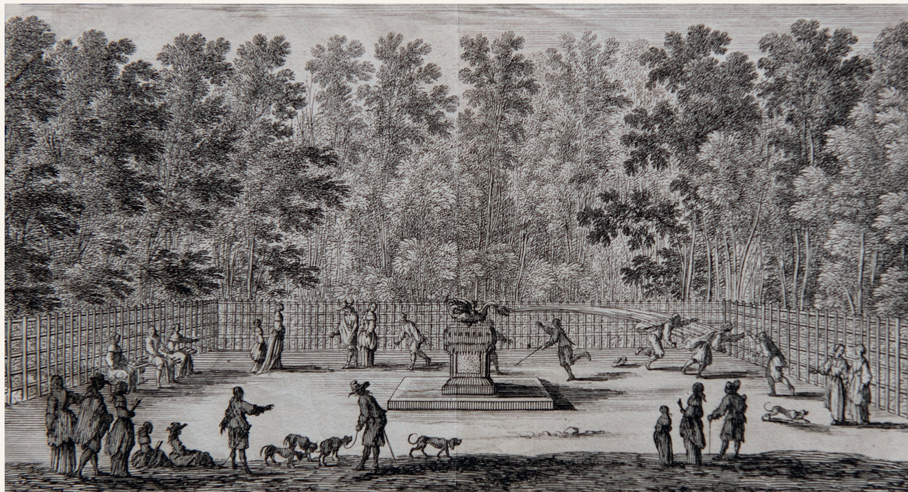
Le bosquet du Dragon. Gravure de Pérelle d'après un dessin d'Israël Silvestre (vers 1660).

Des aires de jeux accueillent les petits avec une abeille et des toboggans dans le bosquet de la Ruhe et les plus grands avec une structure à grimper dans le bosquet des Roseaux.